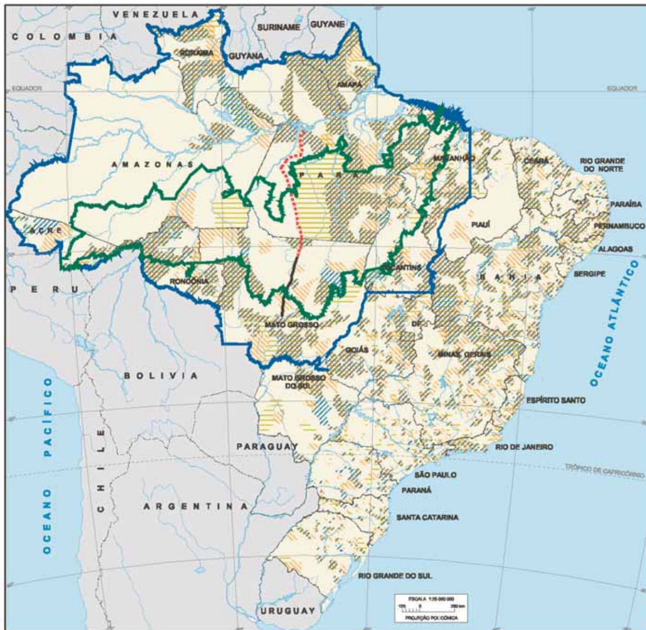
Mapa 21 - Municípios brasileiros que indicaram desmatamento e/ou queimadas afetando as condições de vida e/ou alterando a paisagem, com destaque para a Amazônia Legal, o Arco do Desmatamento e a BR-163 - Brasil - 2002