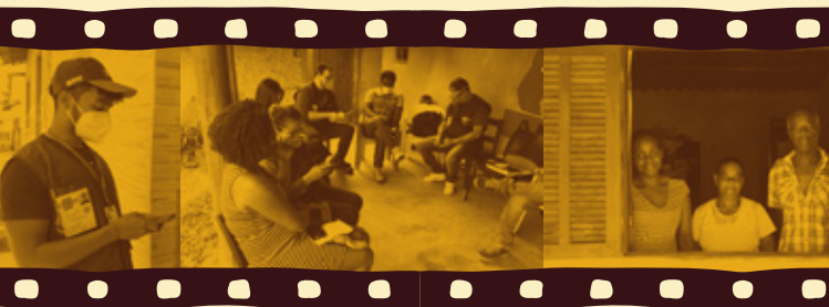
Reunião de abordagem com lideranças quilombolas*

Quando o recenseador do IBGE chegar na sua comunidade, receba-o bem: