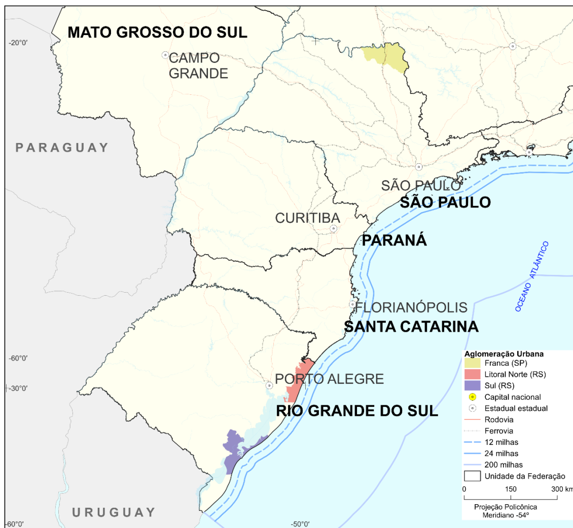
Mapa 14 - Aglomerações Urbanas – 2025