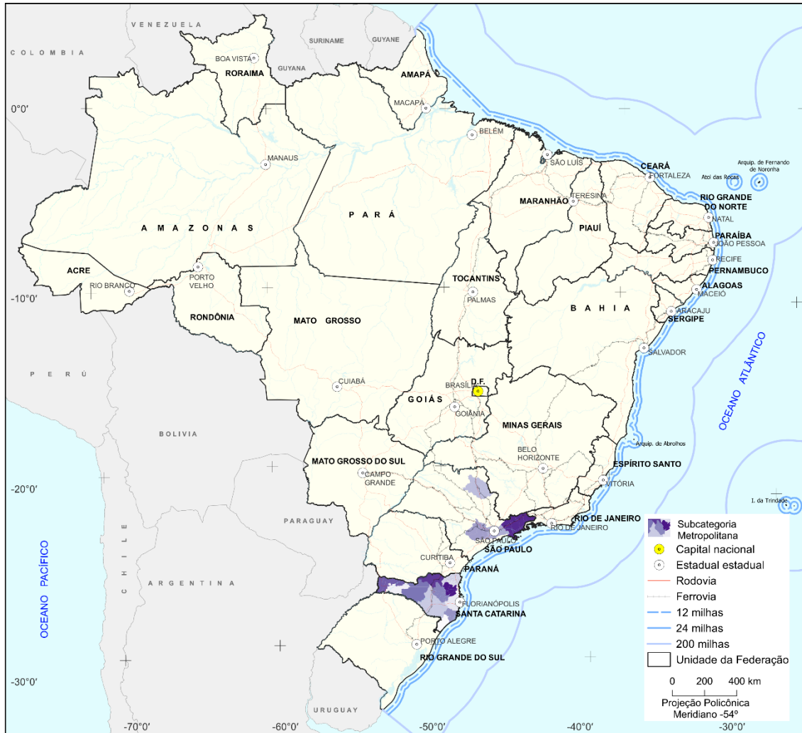
Mapa 13 - Subcategorias Metropolitanas – 2025