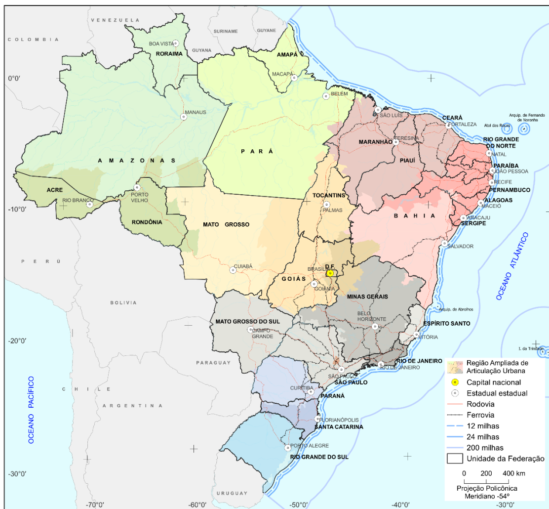
Mapa 58 - Regiões Ampliadas de Articulação Urbana – 2025

Os recortes da Divisão Urbano-Regional obedecem aos limites municipais, mas podem extrapolar os limites estaduais. Os Mapas 58, 59 e 60 apresentam os três níveis de Regiões de Articulação Urbana.